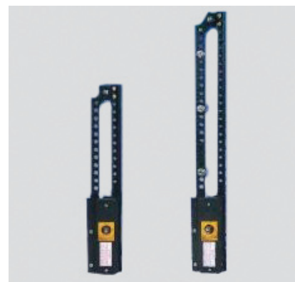
Механизм переключения позволяет собрать из двух выключателей разъединитель переключатель на два направления. Имеет три положения рукоятки I – O – II