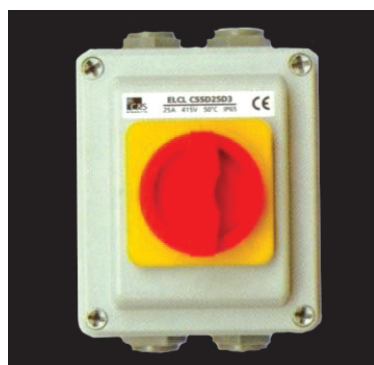
LCL, LBL-Алюминиевые защитные оболочки предназначены для защиты от внешней среды выключателей разъединителей.