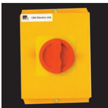
ABW, ACL- Пластиковые защитные оболочки предназначены для защиты от внешней среды выключателей разъединителей