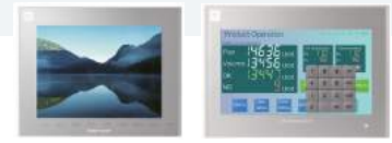
Серия Monitouch V9

Можно управлять приложением и контролировать его работу с помощью функции VPN, интегрированной в Monitouch V9.